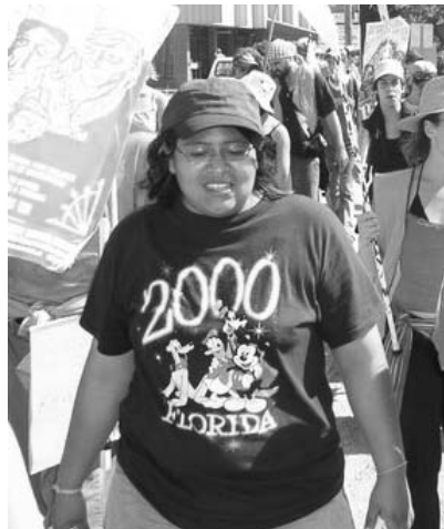
La Juchiteca en una marcha en Montreal, Junio 2005.

Ante ello, y con gran responsabilidad la representación de Solidarité Sans Frontières ha comunicado a organizaciones mexicanas interesadas por difundir la verdad sobre la represión en México, que le han pedido a la denunciada que deje su organización, con lo cual se ha obtenido un paso más en detener la impunidad con la que actúan los aparatos represivos de los Estados de América del Norte (Canadá, México y Estados Unidos), ahora vinculados no sólo por el TLCAN, sino también por el Comando Norte de Estados Unidos, paraguas represivo que vigila y amenaza a los pueblos de esta parte del continente y del Caribe. Presentamos la carta enviada por esa red hermana: