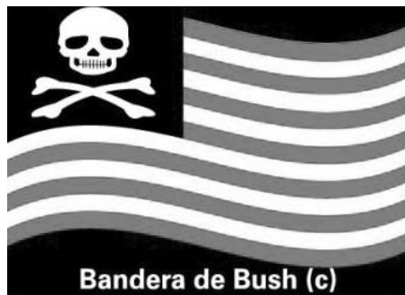
Bandera de Bush (c)

5. La batalla antimperialista es, fundamentalmente, una batalla cultural que implica avanzar en la descolonización de nuestros sentidos del mundo, de nuestras concepciones de lucha, de nuestra lectura de la historia, de nuestras modalidades de resistencia. Es necesario acompañar los procesos de resistencia y de organización de los movimientos populares, con procesos de formación política, ideológica, que basados en la educación popular como contenido y como metodología, permitan avanzar en la creación colectiva de nuestro conocimiento del mundo y de la conciencia sobre las capacidades y posibilidades que tenemos para transformarlo. Educación popular, formación política, creación de valores, mística de combate. Estamos hablando que para derrotar al imperialismo, que es nuestro sueño,