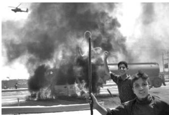
Augusto Zamora R./El Nuevo Diario