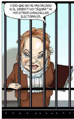
El Fisgón La Jornada 27 de febrero de 2013