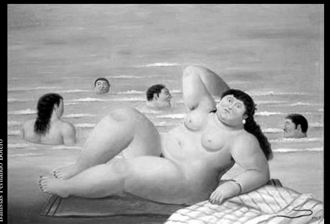
Bañistas Fernando Botero