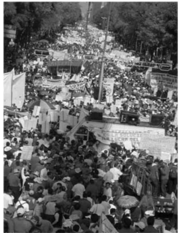
La monumental marcha del 15 de octubre partió del Ángel de la Independencia.