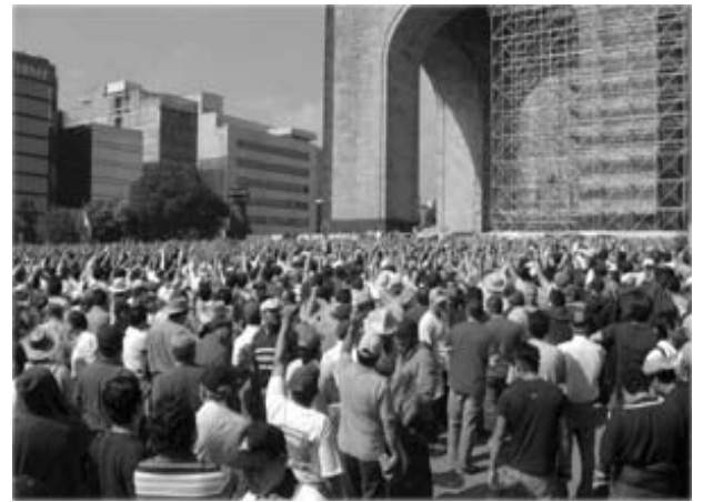
¿Y ahora que sigue? Se preguntan en corillos o mientras escuchan a los oradores, los electricistas. Hay uno que otro: ¡Se los dije, por andar en sus broncas sindicales!