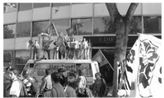
En ánimo de lucha se ha acrecentado. Vamos por la huelga nacional.