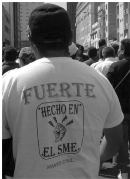
Como reza la leyenda, se requiere un sindicato fuerte.