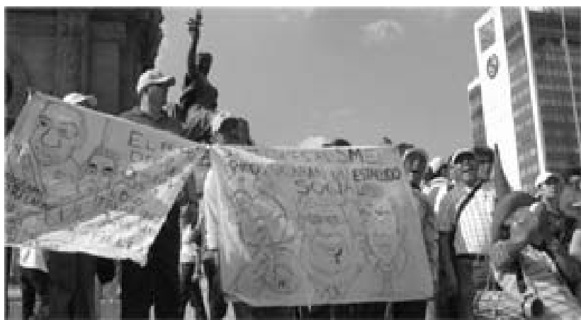
Con el golpe al SME hay quien vislumbra un estallido social.