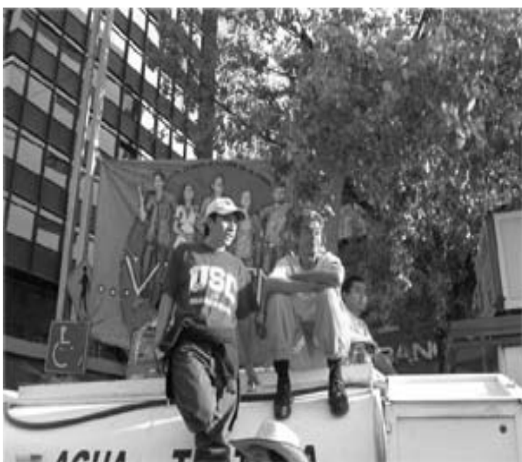
Se busca la unidad de todos, todos los trabajadores.