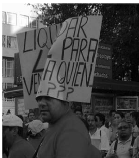
¿Liquidar para vender a quién?