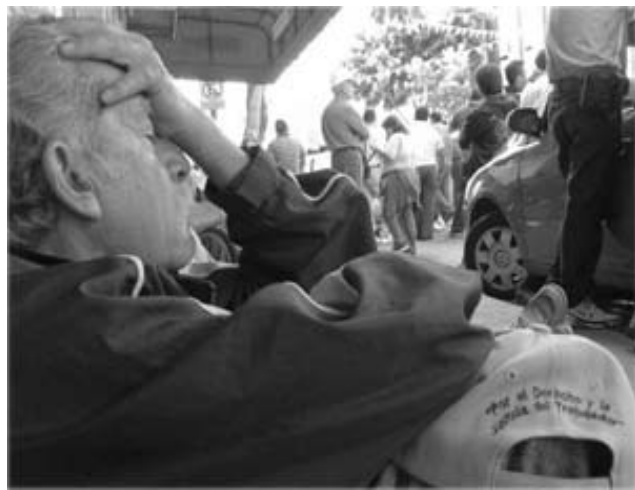
«Por el derecho y la justicia al trabajador» hay que movilizarse y no caer en el desaliento.