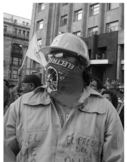
Que los trabajadores se pongan a la altura de la lucha que se reclama y de la solidaridad que se les otorga!