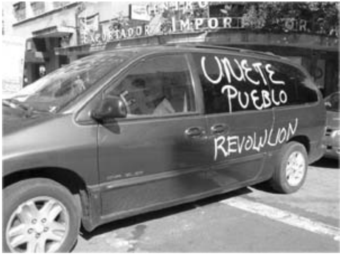
Al día siguiente de la liquidación (11 de octubre) de la Compañía de Luz y Fuerza del Centro, ya había toma de posiciones en algunos (tal vez, muchos más).