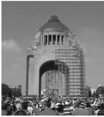
El monumento a la Revolución aloja inmediatamente el enojo de más de 40 mil despedidos. También convoca.