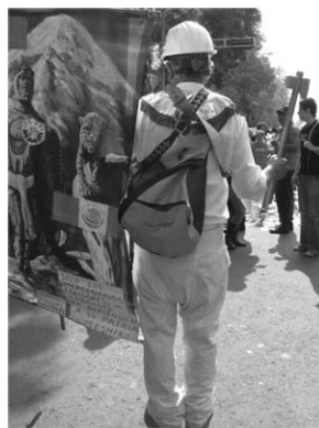
Donde los obreros se convertirán en guerreros (aztecas).