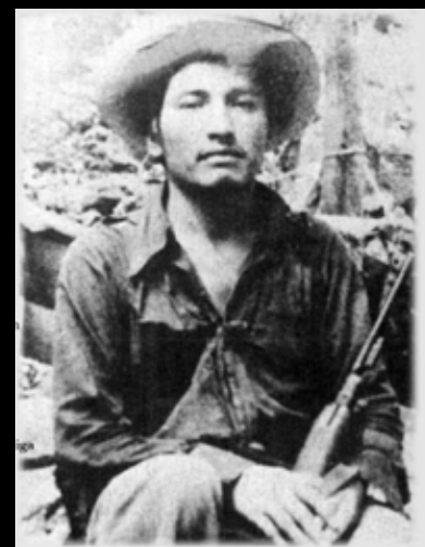
*Colectivo PLOMO CGH-UNAM 1999-2000