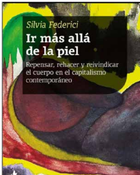
(Fragmentos del libro “Ir más allá de la piel”. Tinta Limón, 2022)