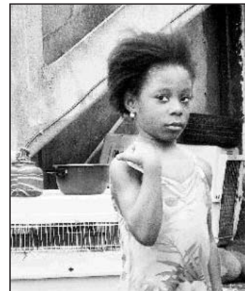
Continúa la agresión racista a migrantes en París. Tres edificios incendiados han provocado manifestaciones de repudio.

Periodismo de más de 400 voces de las redes que construimos el Poder Popular. Participante en la construcción del Movimiento de Lucha Popular.