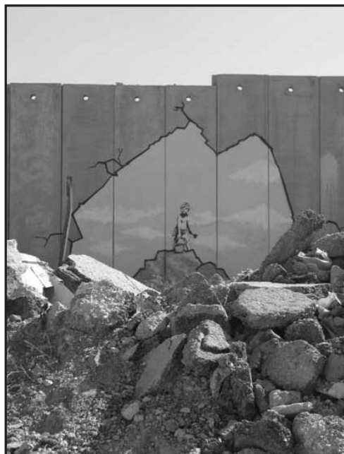
Una de las múltiples expresiones gráficas del arte de resistencia palestino en el muro sionista contra Palestina

Movimiento de Lucha Popular, grupos del Norte y Valle de México a 20 de agosto del 2005