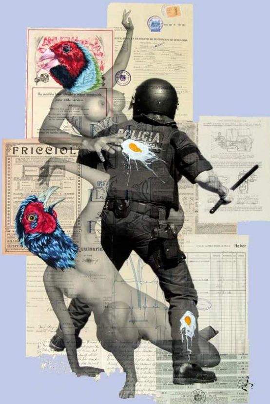
The Rape Of The Sabine Women del artista veneciano Vinz