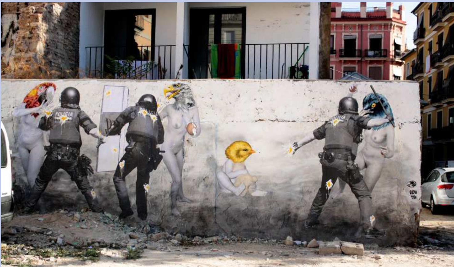
Mural de la obra Don't Be Afraid del artista veneciano Vinz