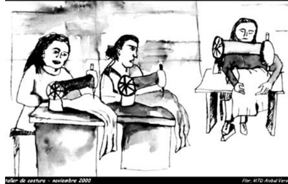
Taller de costura - noviembre 2000

Ahora luchamos como Asociación Civil «Costureras y Costureros 19 de septiembre y continuamos ese proyecto original, no claudicamos ante nada ni nadie.